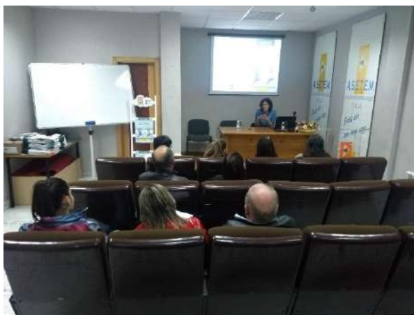
Instantánea da xornada organizada en Melide

En total acudiron 46 asistentes (32 mulleres e 14 homes), a maioría autónomos do comercio de proximidade (93%), e tamén traballadores (7%). A duración de cada xornada foi de pouco mais de dúas horas.